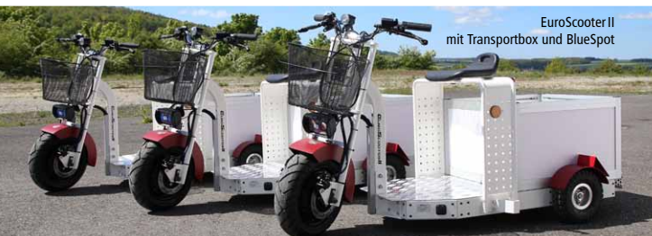
EuroScooter II mit Transportbox und BlueSpot

Prospektboxen und Sichtlagerkästen montierbar am Lochblechrahmen