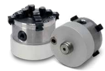
Vierbackenfutter Art.-Nr.: 680800 0661