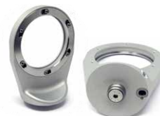
Rohlingshalter für Ronden Ø 98 mm Art.-Nr.: 680800 0662