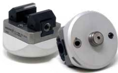
Zentrischspanner - 45–70 mm Backenbreite - 16 KN Spannkraft - optionale Backen verfügbar Art.-Nr.: 680800 0820