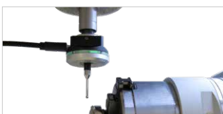
3D-Kantentaster Art.-Nr.: 562542