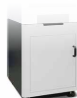
Untergestell - Bauweise: Stahl, Aluminium - Stauraum für Kühlmittelabsaugung - Lagervolumen ca. 0,25 m 3 - Integrierte Nivellierelemente Art.-Nr.: 680800 0690