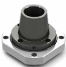
Aufnahme Spannmittel Schmuck Basis-Flansch Art.-Nr.: 680800 0949