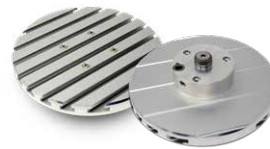
T-Nutenteller Ø 210 mm Art.-Nr.: 680800 0663