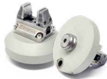
Zentrischspanner - 15–50 mm Backenbreite - 5 KN Spannkraft - optionale Backen verfügbar Art.-Nr.: 680800 0664